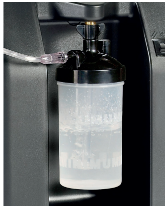
Möglichkeit einen Befeuchterbecher anzuschließen

Der Sauerstoffkonzentrator Compact 525 von DeVilbiss Healthcare bietet höchste Qualität. Mit einer Durchflussleistung von bis zu 5 l/min, einer hohen Sauerstoffkonzentration in allen Floweinstellungen, sowie mit den aktuellsten Produktentwicklungen zur Verringerung von Lautstärke und Stromverbrauch bestückt, erhöht der neue Compact 525 erheblich den Patientenkomfort. Der Compact 525 entspricht den aktuellen Sicherheitsanforderungen. Durch das ergonomische Design ist er leicht zu verstauen, transportieren und zu reinigen. Der Compact 525 kann bei einer Temperatur von 5 bis 40 °C und einer Luftfeuchtigkeit von 10 bis 95 % betrieben werden.