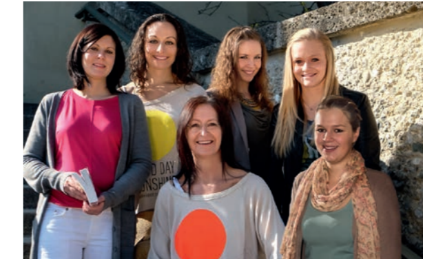
Das Team des Reisebüros am Marienplatz.

Bitte kontaktieren Sie unser Reisebüro bei Inlandsreisen mindestens 2 Wochen vor Reiseantritt, bei Auslandsreisen 4-6 Wochen vor Abreise.