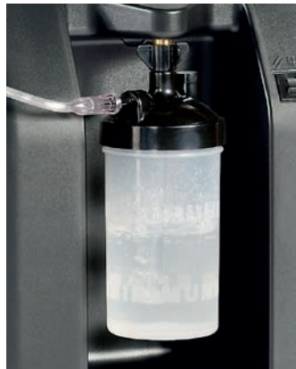
Möglichkeit einen Befeuchterbecher anzuschließen

Der Sauerstoffkonzentrator Compact 525 von DeVilbiss Healthcare bietet höchste Qualität. Mit einer Durchflussleistung von bis zu 5 l/min, einer hohen Sauerstoffkonzentration in allen Floweinstellungen, sowie mit den aktuellsten Produktentwicklungen zur Verringerung von Lautstärke und Stromverbrauch bestückt, erhöht der neue Compact 525 erheblich den Patientenkomfort. Der Compact 525 entspricht den aktuellen Sicherheitsanforderungen. Durch das ergonomische Design ist er leicht zu verstauen, transportieren und zu reinigen. Der Compact 525 kann bei einer Temperatur von 5 bis 35 °C und einer Luftfeuchtigkeit von 15 bis 93 % betrieben werden.